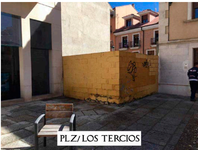
PLZ/ LOS TERCIOS