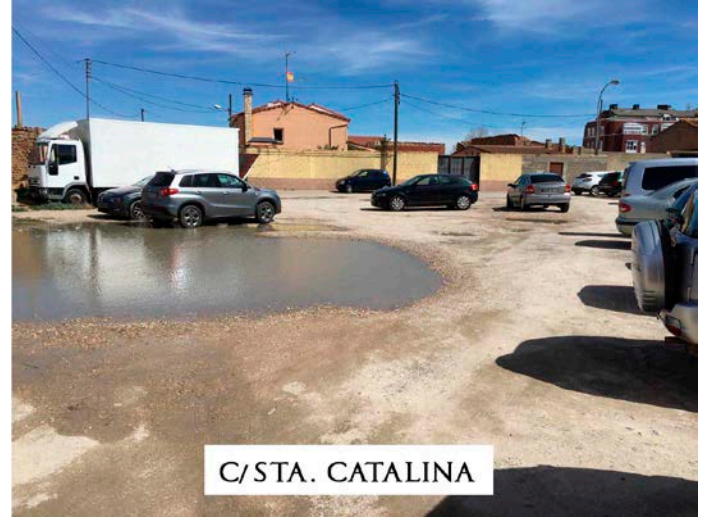
C/ STA. CATALINA