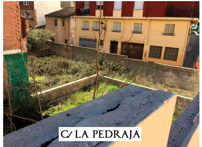
C/ LA PEDRAJA