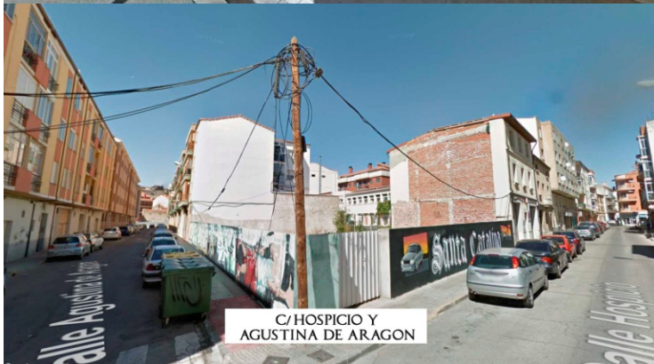
C/ HOSPICIO Y AGUSTINA DE ARAGON