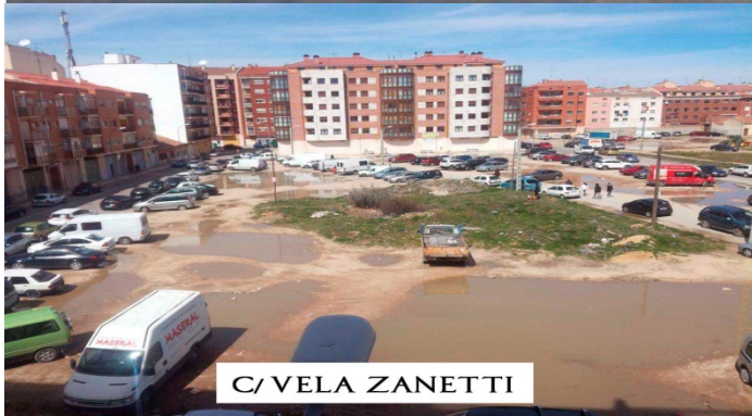
C/ VELA ZANETTI