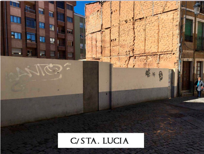
C/ STA. LUCIA