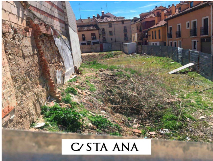
C/ STA ANA