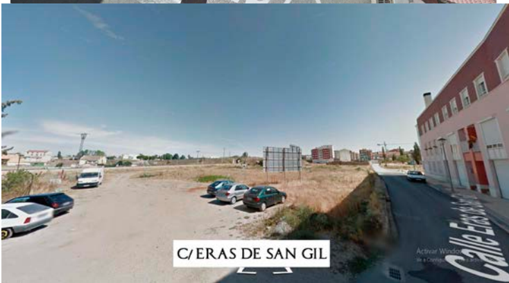
C/ ERAS DE SAN GIL