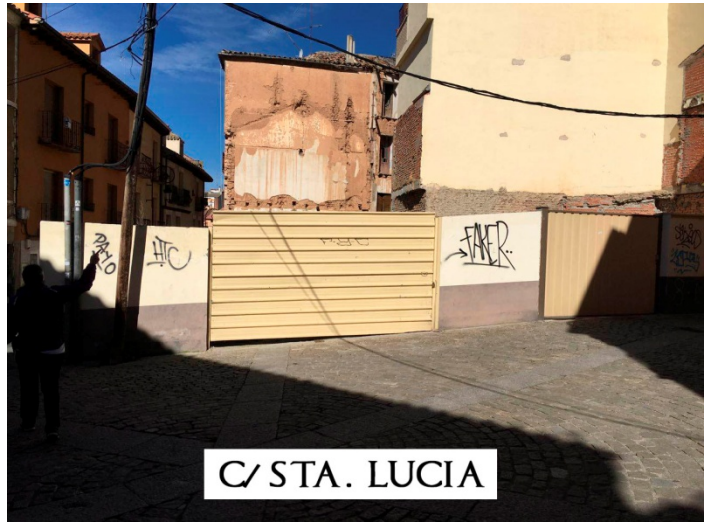
C/ STA. LUCIA