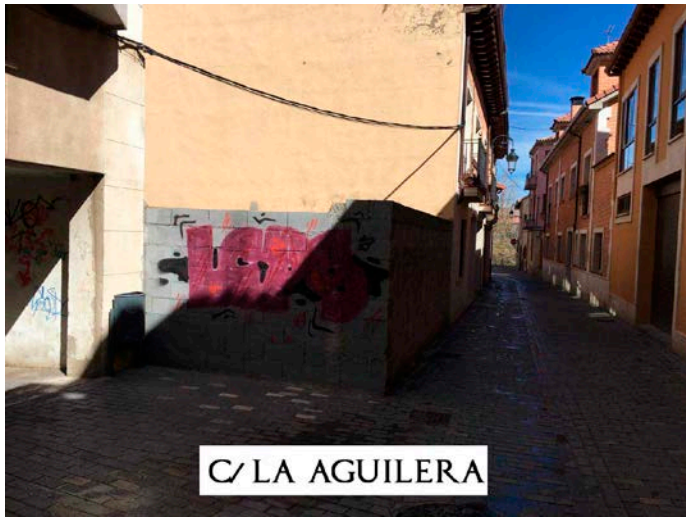
C/ LA AGUILERA