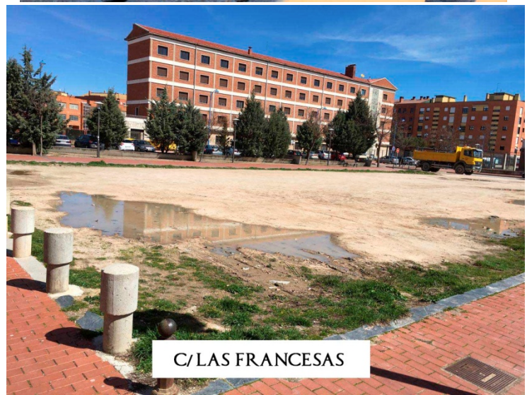
C/ LAS FRANCESAS