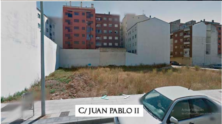
C/ JUAN PABLO II