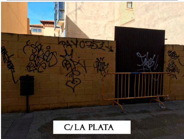
C/ LA PLATA